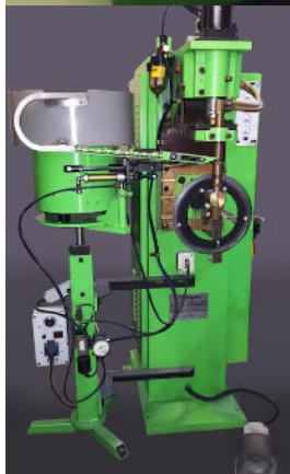
Контактная сварка для приварки ушек