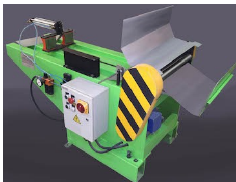
Загибочная машина для предварительного скругления корпусов SARGIANI

630091, г. Новосибирск, Красный проспект, д. 82, 1ц, ОГРН 1135476153702, ИНН 5406761728, КПП 540601001 ОКПО 50382225, р/с 40702810023450000543 в филиале «Новосибирский» АО «АЛЬФА-БАНК» в Новосибирске, БИК 045004774, к/с 30101810600000000774, www.mettara.pro