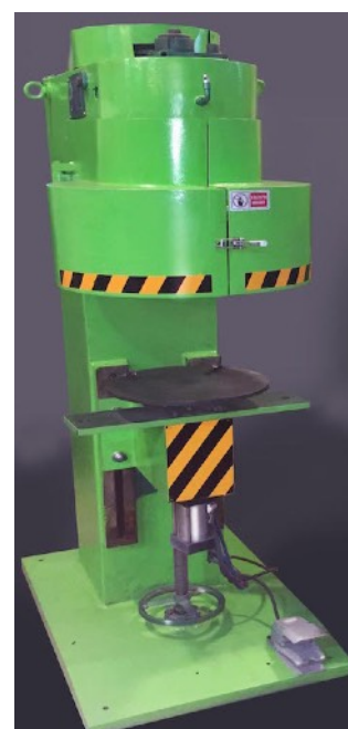
Закаточная машина полуавтоматическая (GT4A 35)