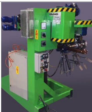
Сварочная машина SARGIANI & SMAG