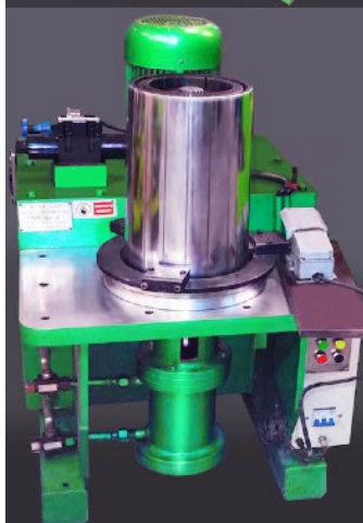
Экспандер гидравлический для растяжки корпусов в конус (YZV-280)