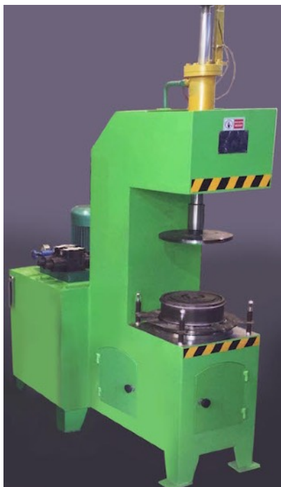
Экспандер гидравлический для растяжки ребра жесткости (НЯО 280 - 2В)

630091, г. Новосибирск, Красный проспект, д. 82, 1ц, ОГРН 1135476153702, ИНН 5406761728, КПП 540601001 ОКПО 50382225, р/с 40702810023450000543 в филиале «Новосибирский» АО «АЛЬФА-БАНК» в Новосибирске, БИК 045004774, к/с 30101810600000000774, www.mettara.pro