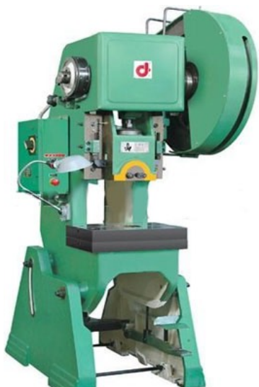
Прессы 60, 40 и 16 тн

630091, г. Новосибирск, Красный проспект, д. 82, 1ц, ОГРН 1135476153702, ИНН 5406761728, КПП 540601001 ОКПО 50382225, р/с 40702810023450000543 в филиале «Новосибирский» АО «АЛЬФА-БАНК» в Новосибирске, БИК 045004774, к/с 30101810600000000774, www.mettara.pro